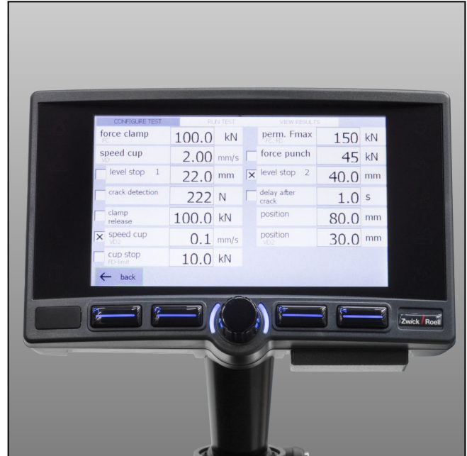
Display für BUP 100 / 200 (1048582)