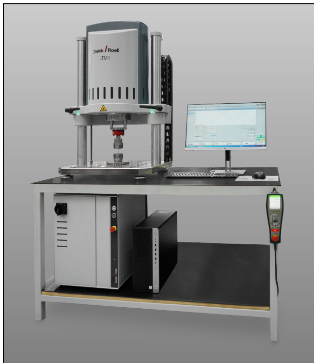
Prüfmaschine LTM 1/2 als Tischmodell