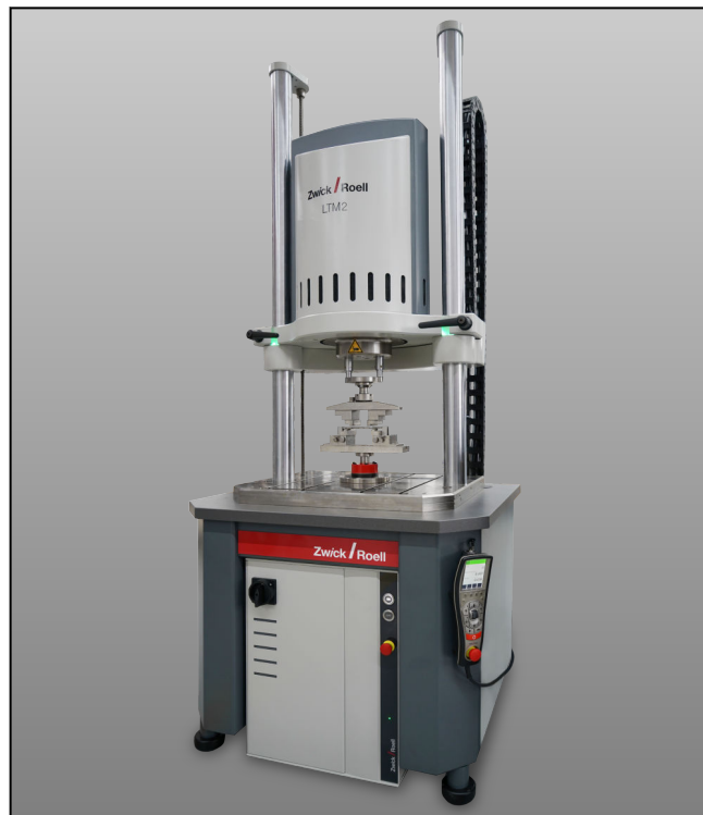
Prüfmaschine LTM 1/2 als Standmodell mit Sockel